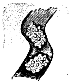
Espumisan® Gold Perlen gegen Blähungen